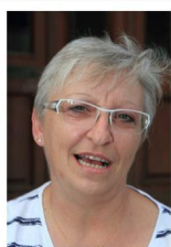
J. Durieu Urbanisme Écologie Environnement