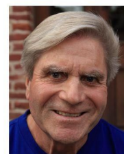
D. Lesut Travaux Service technique