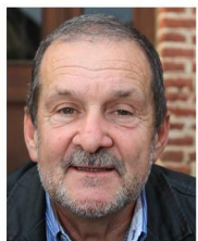
G. Gilet Ecole Associations