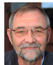
S. Arinal Finances Aménagement du territoire