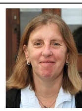
C. Lefort Cimetière: gestion des concessions