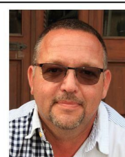
S. Delfrate Communication (bulletin, site internet ...)