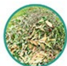
Petits branchages (- de 3cm de diamètre)