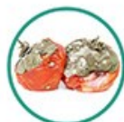
Fruits / légumes pourris

Déposez votre poubelle la veille au soir soit le lundi soir.