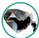
Marc de café