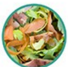
Epluchures de légumes / fruits